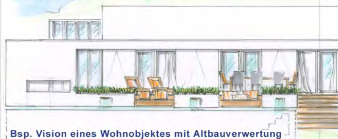
Bsp. Vision eines Wohnobjektes mit Altbauverwertung

"Es ist erstaunlich, wie beschwingt die Kunden sind, wenn die Immobilie geklärt ist".