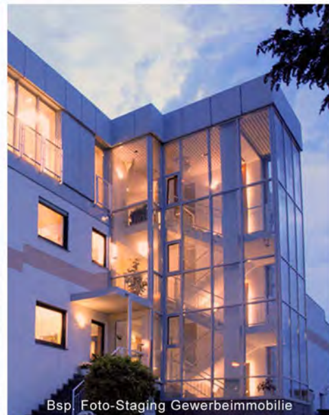
Bsp. Foto-Staging Gewerbeimmobilie