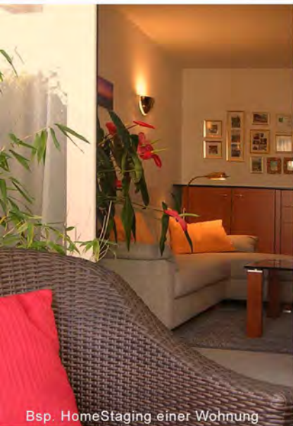
Bsp. HomeStaging einer Wohnung

Styling + Mietmöbel auf Anfrage Fotos, Immo-Film auf Anfrage